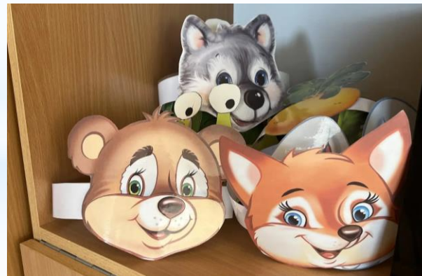
Атрибуты для подвижных игр

Султанчики, мешочки, кегли, кубики, мячи, мешочки, гантели, скакалки