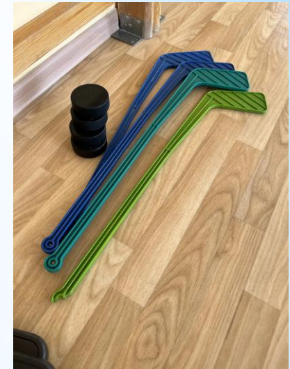
Ленточки, косички, гимнастические палки, клюшки

Султанчики, мешочки, кегли, кубики, мячи, мешочки, гантели, скакалки